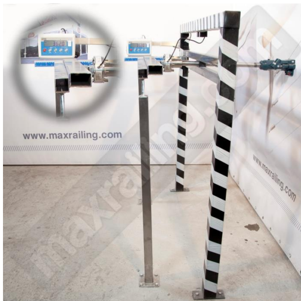
Височина 105см. 360N