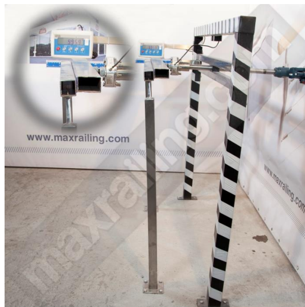
Височина 105см. 1000N