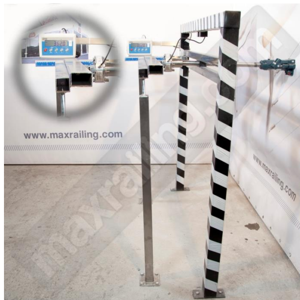
Височина 105см. 360N