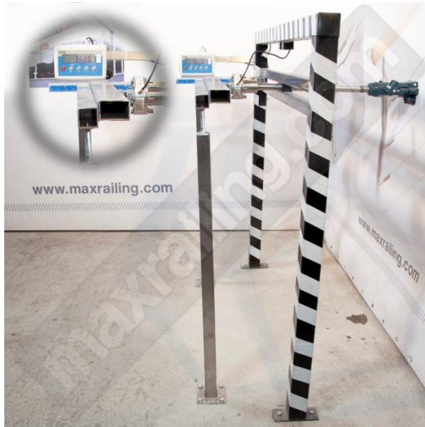
Височина 105см. 360N