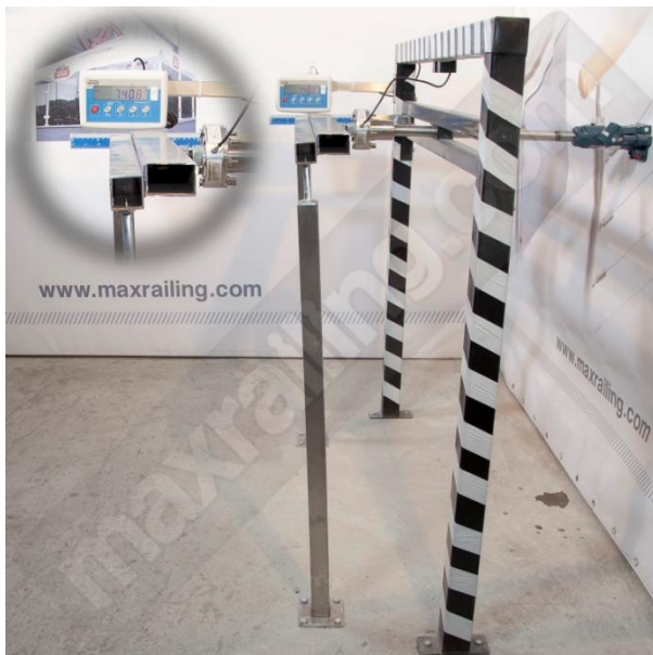
Височина 105см. 750N