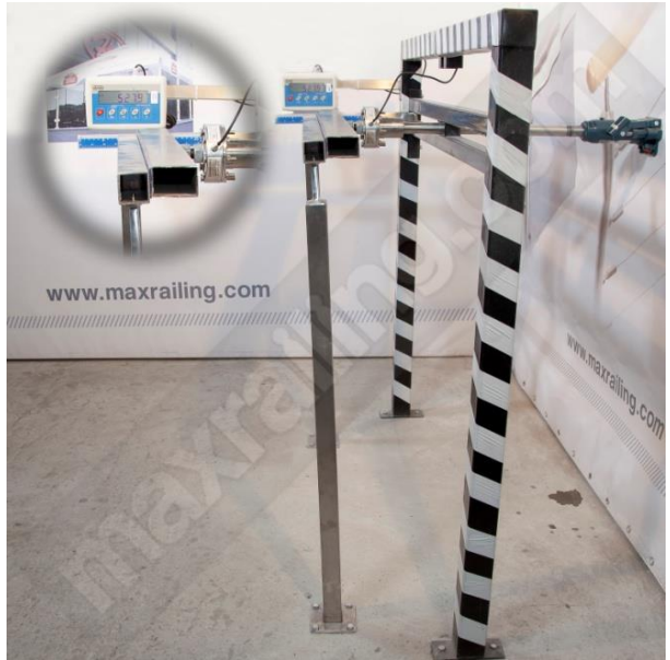
Височина 105см. 500N