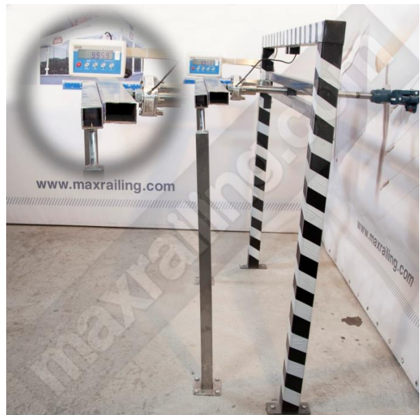
Височина 105см. 1000N