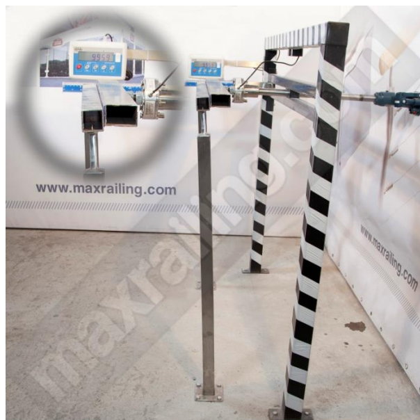
Височина 105см. 1000N