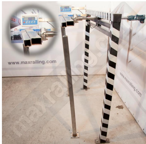
Височина 120см. 1000N