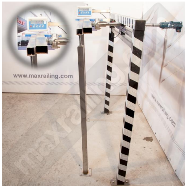
Височина 120см. 750N