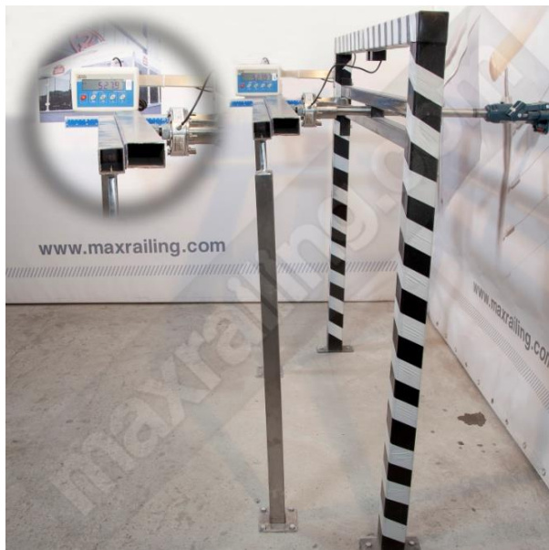
Височина 105см. 500N