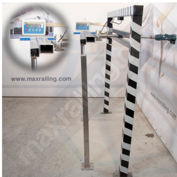
Височина 105см. 750N