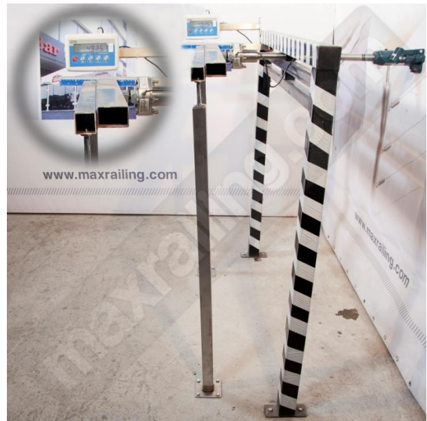
Височина 120см. 500N